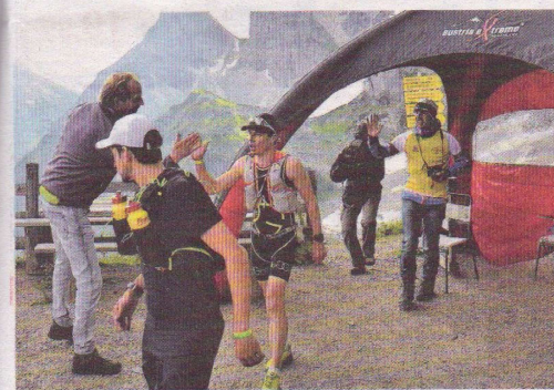
Ein Zwischenstopp: Ist die Südwand beim Laufen erreicht, haben die Athleten den Großteil bereits geschafft.

In einem Seitenarm der Mur bei Thondorf ist der Ausstieg. Über